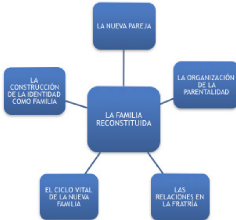
Mapa conceptual 1

Dentro de la categoría “La nueva pareja” han surgido varias subcategorías (ver Mapa conceptual 2).